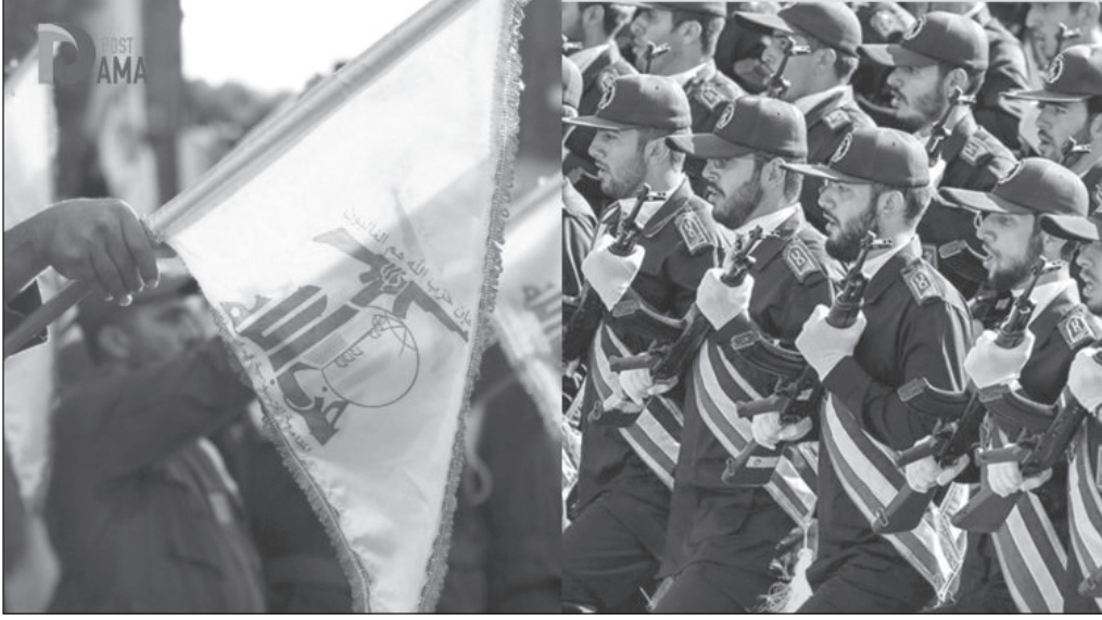
الحرس الثوري الإيراني - حزب الله.

الإسناد مكبلاً، بمعنى منعه من أي تصعيد يوازي ما يتعرض له من ضربات على المستوى العسكري والاختراق الأمني.