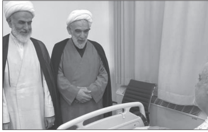
السفير الإيراني في لبنان مجتبي أمانى بعد إصابته بتفجيرات البيجرز

- أعلنت وزارة الصحة أن الحصيلة التراكمية للضحايا منذ ٨ تشرين الأول هي ٢٣٠٦ قتيلاً و١٠٦٩٨ وأن حصيلة اليوم السابق بلغت ٥١ قتيلاً و١٧٤٠ جريحاً.