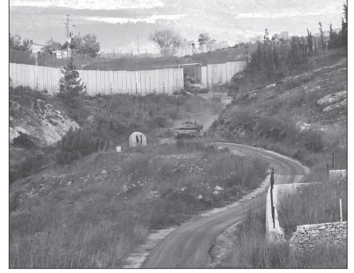
الدخول الإسرائيلي إلى لبنان، ٢ أيلول ٢٠٢٤

- أعلن «حزب الله» إطلاق «صلية» من صواريخ فادي ١ على قاعدة الكرمل جنوب حيفا، وصلية صاروخية على قاعدة غليلوت