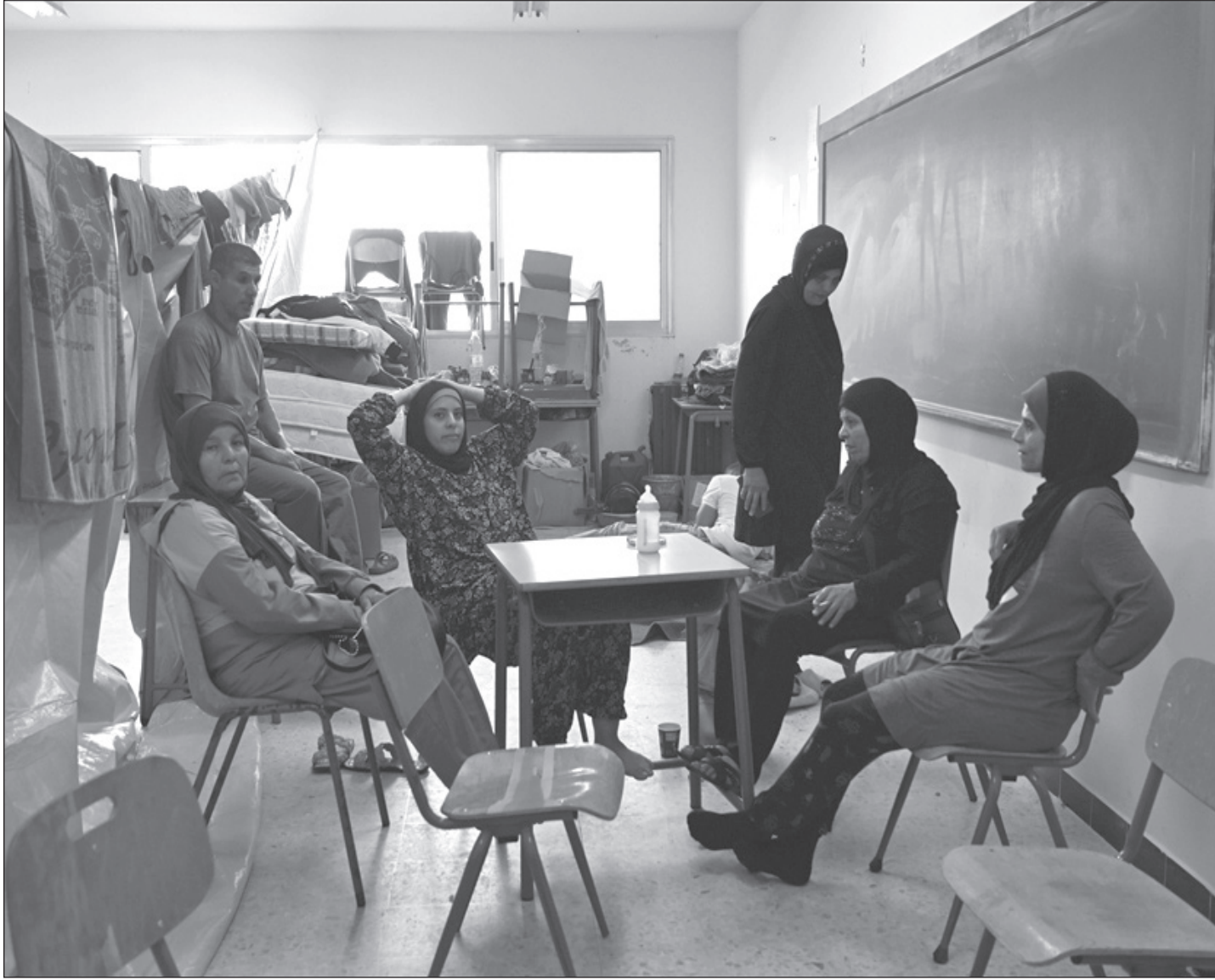
ينتظرون عودتهم إلى قراهم في إحدى المدارس المعتمدة مركز إيواء.

يساعدون النازحين، ويجمعون التبرعات عبر وسائل التواصل دون وجود أي آليات تأكد بأن الأموال تذهب إلى الجهة الصحيحة.