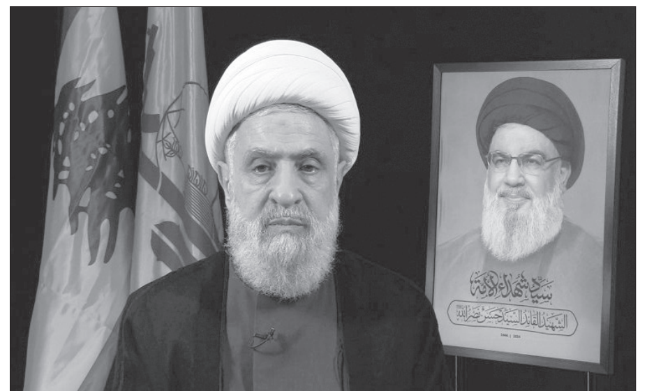
الشيخ نعيم قاسم أمين عام حزب الله

الثاني: إيجاد بيئة تساعد الأولاد على الطاعة. عنها قال: