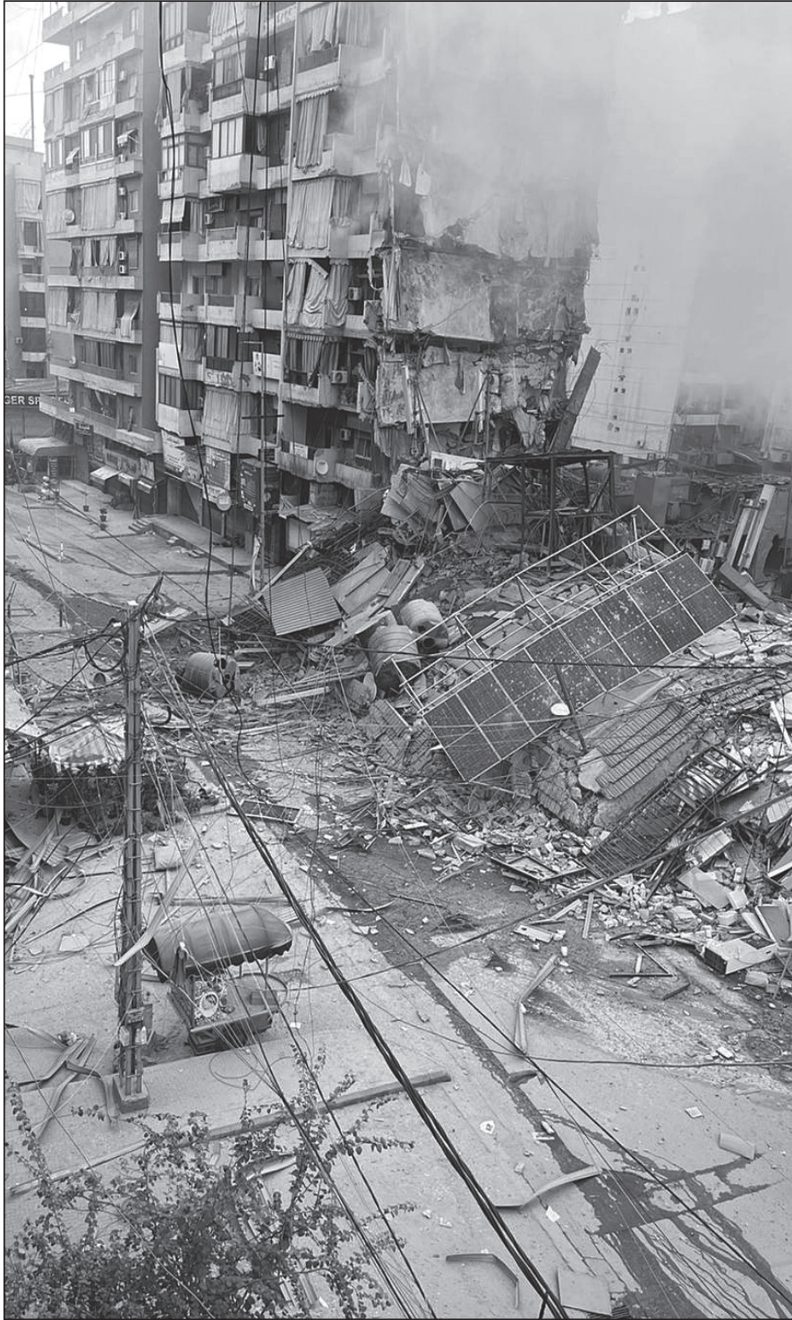
الدمار في الضاحية الجنوبية لبيروت.

الكثير من المجتمع الدولي. وعلى حدّ تعبير أحد المراقبين المخضرمين «المفارقة المركزية في عام ١٩٦٧ هي أنه من خلال هزيمة العرب، أُحيّت إسرائيل الفلسطينيين».