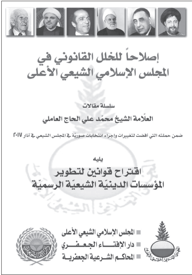
كتاب إصلاحاً للخلل القانوني في المجلس الإسلامي الشيعي الأعلى

كانوا على الدوام يسعون لعقد تحالف مع الحزب، ولا يتحدثون معنا أو يلجأون إلينا إلا عندما يكون الحزب قد لفظهم ولم يُعزهم اعتباراً، وأقصد بذلك المستقبل والقوات والاشتراكي... ولا أستثني أحداً.