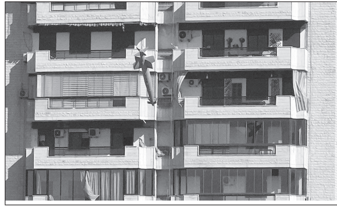
صاروخ يصيب مبنى في الغبيري

- استمرار الغارات على مناطق واسعة من الجنوب والبقاع وغارات على الضاحية استهدفت برج البراجنة والعمروسية وحارة حريك والحدث.