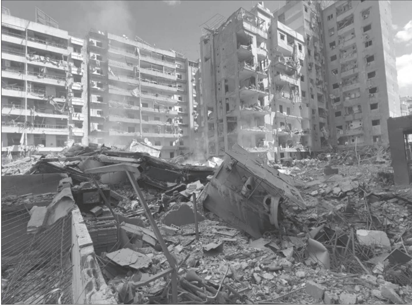
الدمار في الضاحية الجنوبية لبيروت.

الأمن ضد إسرائيل... ولكن سرّياً جداً وبعد الاحتكاك بهم، ارتكب بعض الفدائيين تجاوزات كبيرة بحق المواطنين».