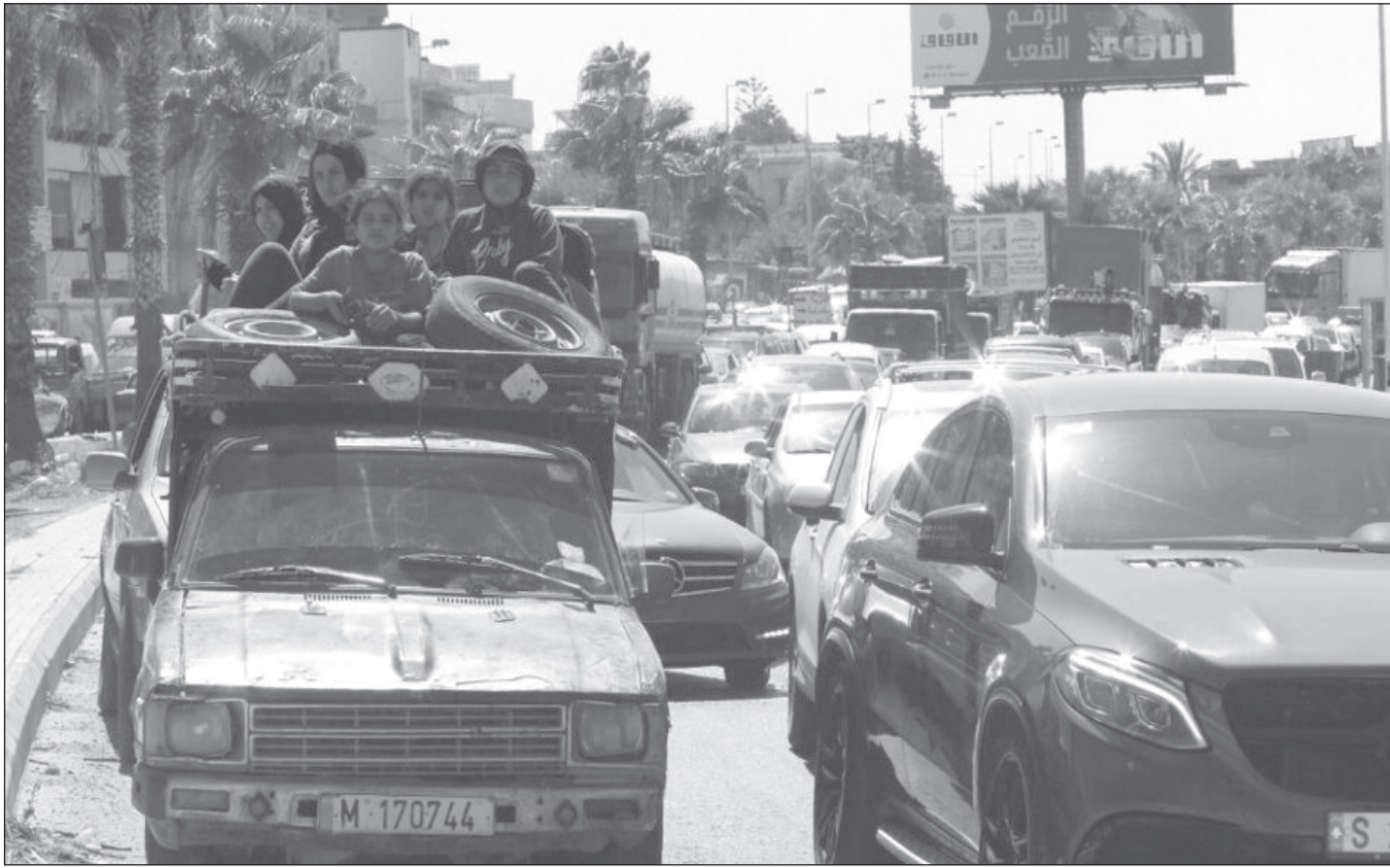
النزوح الكبير في ٢٣ أيلول