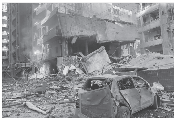
الدمار في مدينة صور

- وزارة الصحة: ٢٣٠٩ شهيداً و١٠٧٨٢ جريحاً منذ ٨ تشرين الأول ٢٠٢٣ وحصيلة اليوم السابق ٣ شهداء و٨٤٤ جريحاً.