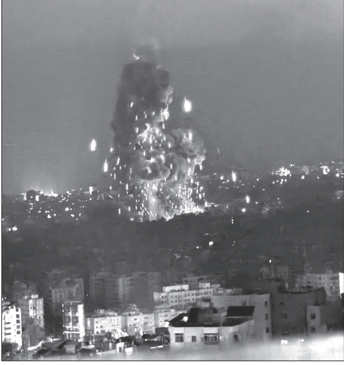
غارة على الضاحية

التابعة لوحدة الاستخبارات العسكرية ٨٢٠٠ الواقعة في ضواحي تل أبيب.