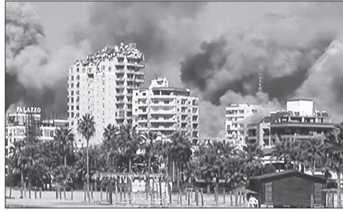
الغارات على مدينة صور

لأخيه، كان منه بمنزلة أبي الفضل العباس عليه السلام من أخيه الإمام الحسين عليه السلام»، وقد عزّى حسين سلامي، قائد حرس الثورة الإسلامية، «الشعب اللبناني و«حزب الله» باستشهاد المجاهد السيد هاشم صفي الدين».