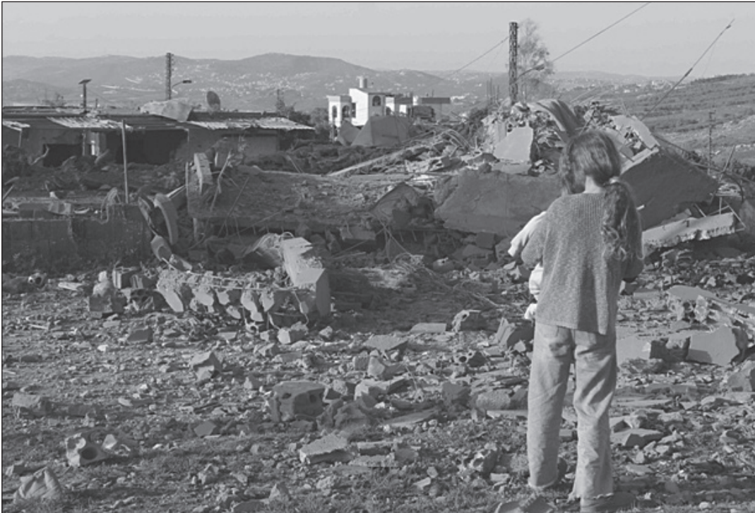
طفلة تتفقد آثار غارة جوية استهدفت منزلاً في بلدة دبين بجنوب لبنان ليل الثلاثاء