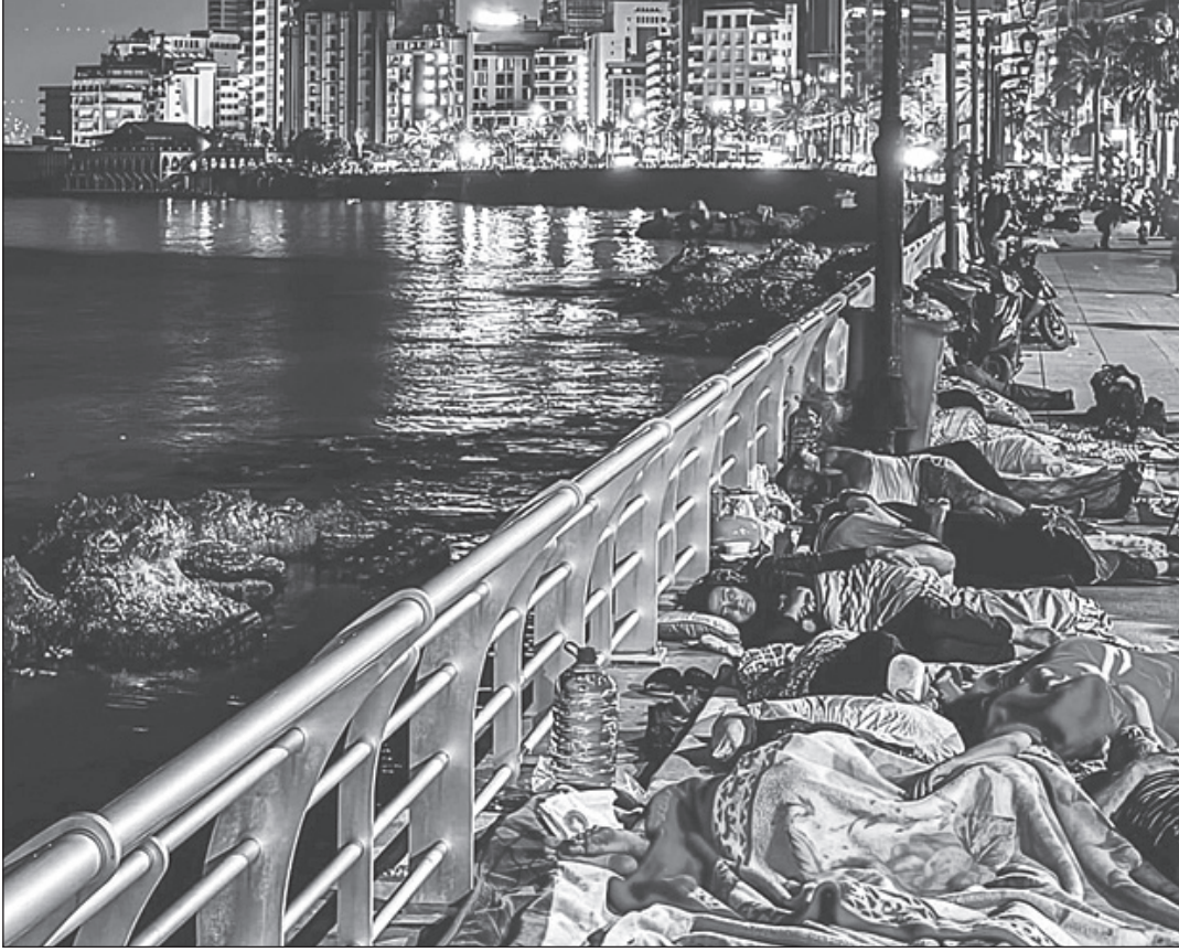
نازحون يفتشون الرصيف البحري

ولمّا كان الكلام لا يكفي لوصف ما يحدث اليوم فإنّ الصّور كفيّلة بنقل معنى النكبة الحالية التي بدأت إرهاباتها منذ ٨ تشرين الأول