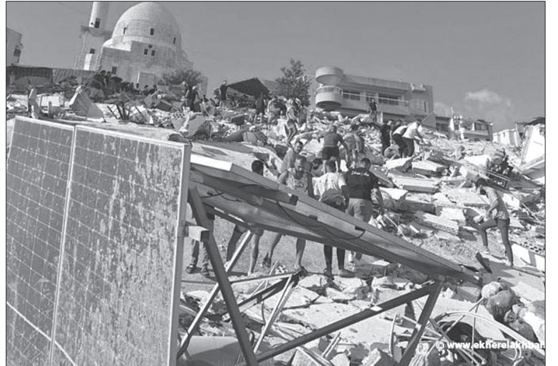
مجزرة عين الدلب