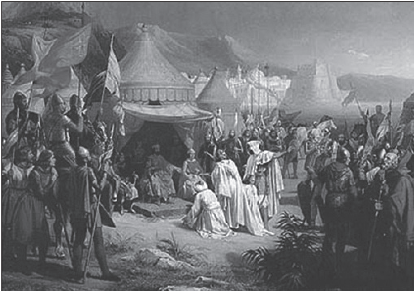
بيرتراند كونت تولوز يتلقى استسلام القاضي فخر الملك بن عمار بعد الاستيلاء على مدينة طرابلس، الرسم أمر به لوي- فيليب للمتحف التاريخي في فرساي عام ١٨٣٨، ونقده عام ١٨٤٢ الرسّام ألكسندر شارل ديك

إلا ان ما يحدث اليوم هو اشبه ما يكن بنكبة شاملة