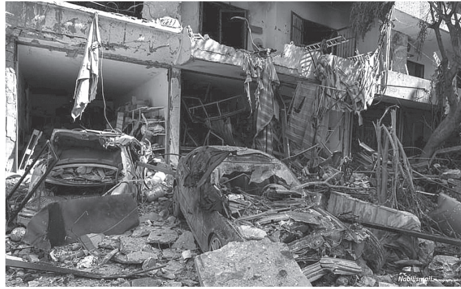
ضاحية بيروت الجنوبية بعدد ليل من الغارات

كان اتفاق الطائف، بطريقة أو أخرى، بداية جديدة للتعيش اللبناني الداخلي وللتعامل مع الخارج. ومنذ ذلك الحين، يمكن القول - وإن في هذا القول الكثير من الوهم - إننا عشنا قرابة الثلاثين عامًا تحت نظام وصيغة حكم مختلفين تمامًا عما كان قبلهما.