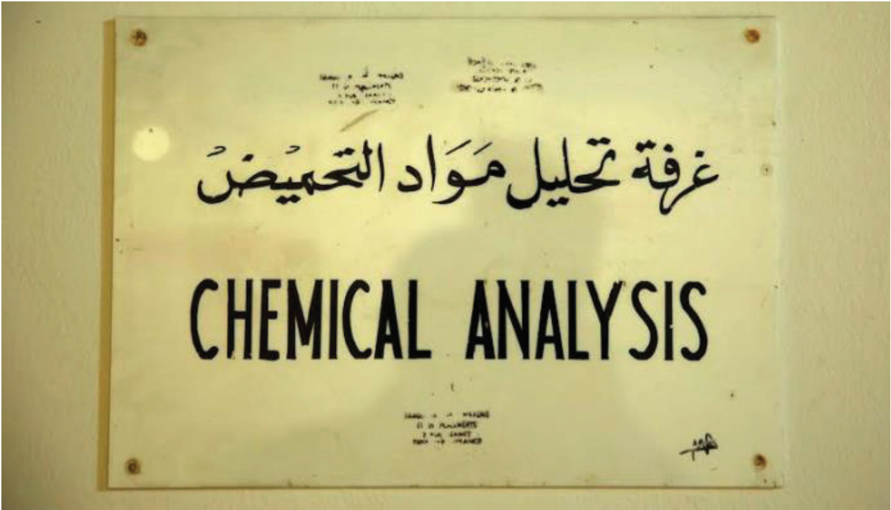
من موجودات استديو بعلبك

التأمل في تفاصيل هذه المحفوظات، يكفي لشحن خيالنا بصور لبيروت في عصرها الذهبي، إذ يكتشف الزائر عناوين لأفلام شكلت جزءاً من نجاحات السينما اللبنانية والعربية آنذاك، منها فيلم "كفاح حتى التحرير"، "مدرسة الرتباء"، و"رسول الغرام" لأبوسليم. كما تستوقفنا قصص من نجاحات وخيبات الاستديو، تحدثنا عنها جداريات المعرض والكتيبات الموزعة فيه. فاستديو بعلبك، تأسس في العام ١٩٥٢، باسم أولي هو "الشركة اللبنانية للتسجيلات الفنية"، وتخصص بتسجيل وإنتاج الموسيقى والأغنيات والأفلام السينمائية اللبنانية والعربية. وكان صرحاً جامعاً لهامات فنية عملاقة مثل أم كلثوم، عبد الحليم حافظ، فريد الأطرش، الأخوين منصور وعاصي الرحباني، فيروز وغيرهم من النجوم الكبار في عالم الموسيقى والتمثيل والإخراج. لكن حال هذا الصرح الفني التاريخي تقاطع، بعد سنوات الحرب اللبنانية مع أحوال رموز ومرافق تراثية وثقافية أخرى، كان الإهمال مصيرها. إذ أفضل الاستديو مرة أولى في منتصف الثمانينيات ومرة ثانية وأخيرة في منتصف التسعينيات، بعد إعادة افتتاحه العام ١٩٩٢.